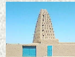
Mosquée Emiskini - Agadez

REGION D'AGADEZ DIRECTION REGIONALE DE L'INSTITUT NATIONAL DE LA STATISTIQUE Tél:+227 20440914, Fax: +227 20440916 E-mail : agadez@ins.ne