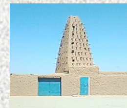
Mosquée Emiskini - Agadez