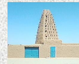
Mosquée Emiskini - Agadez