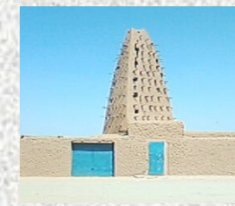
Mosquée Emiskini - Agadez