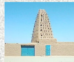
Mosquée Emiskini - Agadez